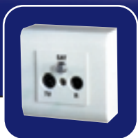
Prise murale de raccordement satellite